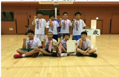
バンビカップ男子優勝：千歳ミニバス