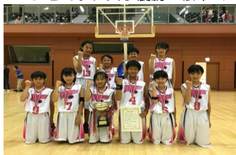
バンビカップ女子優勝：桜木ミニバス