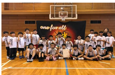
会長杯男子優勝：千歳ミニバス