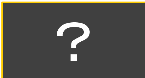
デンソー北海道CUP男子優勝：???